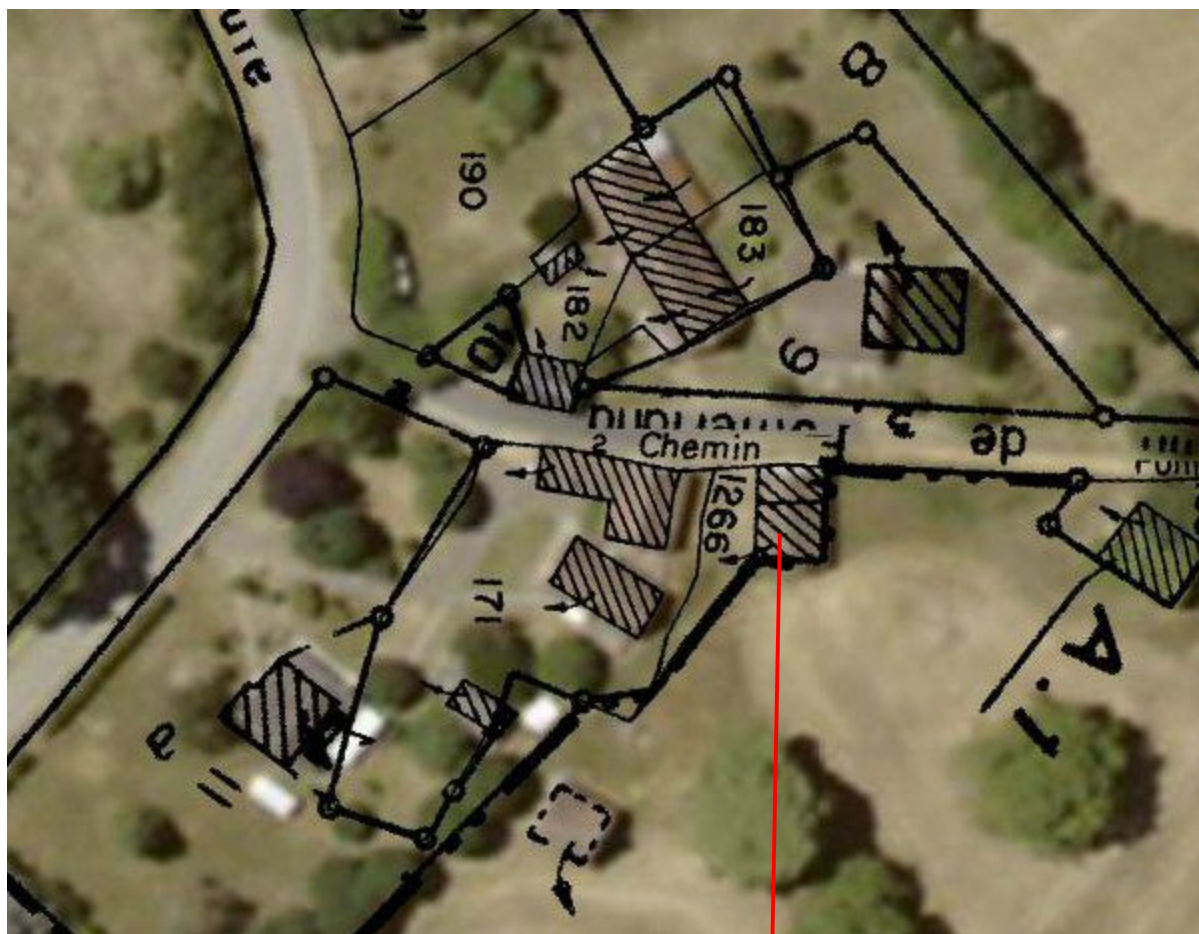
Cadastre actuel, section ?, Géoportail