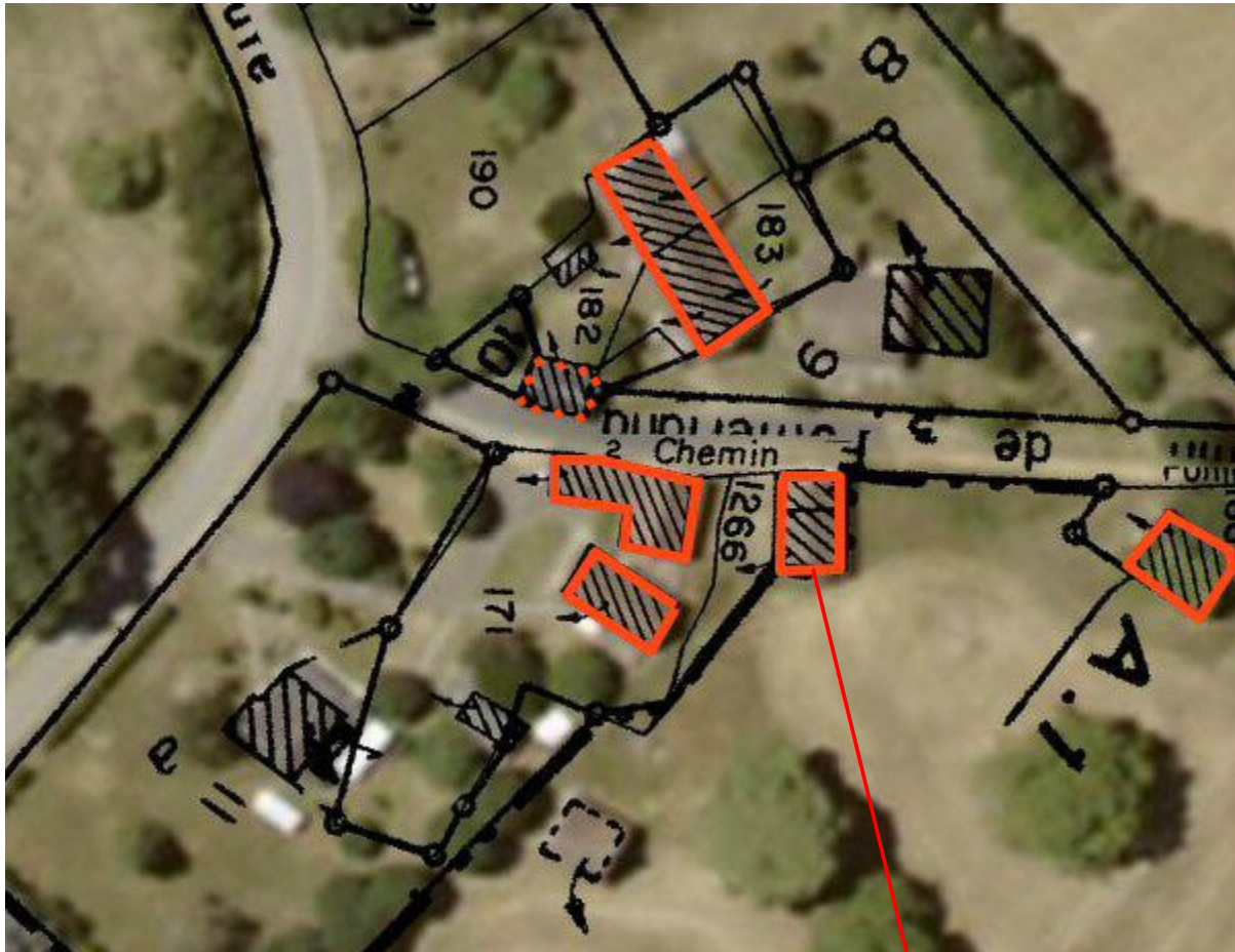
Pierre qui roule

A priori « Pierre qui roule » avait déjà les mêmes dimensions, elle date donc d'au moins 1812 (ce qui est évident quand on la voit, mais ça le prouve !).