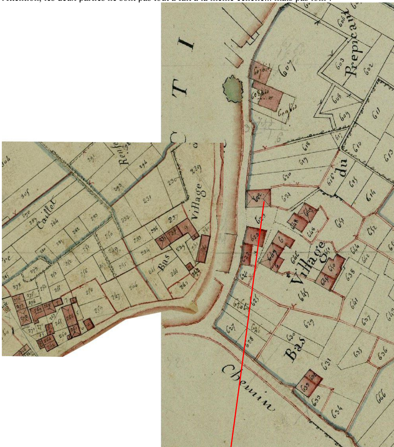
Pierre qui roule

Cadastre 1812 Preuilly-la-Ville, à gauche section A1 « de l'église », à droite section D1 « des Grands Champs » Attention, les deux parties ne sont pas tout à fait à la même échelle... mais pas loin !